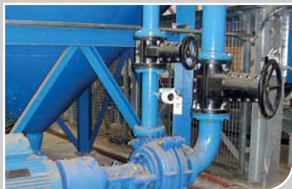
在Sims 金属再生公司的枫诺PVEG 阀门

在2011年初，Sims 金属再生公司在英国的一个金属再生工厂选用了枫诺PVEG 阀门。手动操作，且重量轻盈的PVEG 阀门用于重介质选矿中泵和料罐的隔离。枫诺产品成为Sims公司在新产品和分离技术方面持续投资的重要部分，并用最少的成本，为公司回收了最多的金属。