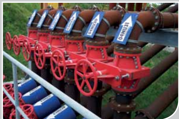
安装在DONG能源公司的枫诺管夹阀

DONG 能源公司是丹麦的一家大型火力发电厂，他们在锅炉灰/炉渣浆上安装了枫诺阀门，并获得了巨大收益。在这个应用中，锅炉灰/炉渣经磨碎后，与海水搅拌，然后泵送到沉淀池。在1996年，31台枫诺管夹阀安装在这个工艺中。这种磨损性和腐蚀性极强的料浆对料浆的开闭设定了高要求，而枫诺阀门完全满足需要。卓越的耐磨性，可靠的运行和长久的胶管寿命都给客户带来了效益。